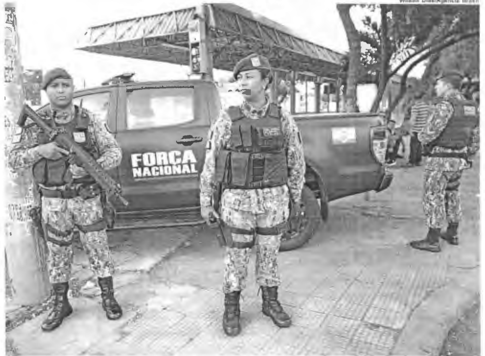
Esquadrão da Polícia Militar será reforçado

O governo do Ceará planeja convocar até 1,2 mil policiais e bombeiros militares da reserva para reforçar o patrulhamento nas ruas e, assim, enfrentar a onda de ataques criminosos no estado, que chegou ontem (14) ao 13º dia. A convocação dos militares da reserva é parte das medidas aprovadas pela Assembleia Legislativa e sancionadas pelo governador Camilo Santana. Além da convocação emergencial de militares reformados nos últimos cinco anos, aprovados nos exames de saúde e físicos, as novas