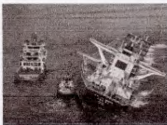
A reportagem de O Imparcial sobre o acidente com o navio.