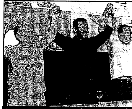
O SDD LANÇOU ALEM DA PRÉ-CANDIDATURA DI

“Eu fiz questão de vir aqui, porque sei da importância de disputar essa capital. Essa capital [São Luís] é uma das mais importante